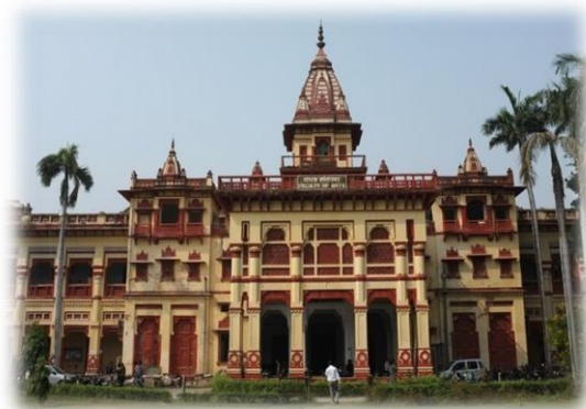
אוניברסיטת וארנסי, הפקולטה לאומנות