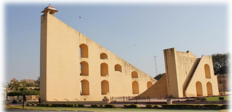
מצפה הכוכבים ג'אנטר מאנטר

לאחר ארוחת הבוקר ניסע לעיר ג'איפור העיר הוורודה, בירת מחוז רג'יסטאן. עם ההגעה בשעות הצהריים, נצא לסיור מקצועי בעיר הבנויה מאבן וורודה המצויה באזור. נשקיף אל עבר ארמון הרוחות אשר נמנה על אחד מסימני ההיכר של ג'איפור ומבנהו משקף את האומנות הראג'פוטית להווייתה. נמשיך לסיור מקצועי ב"אוסף" המבנים המוזרים המהווים את מצפה הכוכבים ג'אנטר מאנטר (קישור) של ג'יי סינג השליט חובב האסטרונומיה אשר על שמו נקראת ג'איפור ומשמש אסטרונומים עד היום. העברה למלוננו Crowne Plaza לארוחת ערב ולינה.