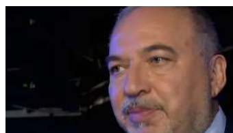
משרד האוצר: "בעלי משכנתא ייהנו מהוזלה משמעותית בביטוח החיים" חשבון בטוח | ממומן