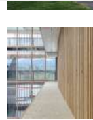
Wood-based materials in EGGER Headquarters|EGGER

When Silo City was built in 1906 during Buffalo's heyday as a grain port and flour milling hub of the American Malting Corporation, the city prospered to unparalleled wealth. The geographically advantageous location by Niagara Falls and the Erie Canal helped Buffalo become the first American city with widespread electricity—this prompted the construction of groundbreaking architecture. The construction of Silo City's American Grain Elevator in 1906 was the first pouring of monolithic concrete in the country.