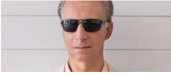
מתי כספי מבטל את הופעותיו בארץ: "לא אשתף פעולה עם דיקטטורה ופאשיזם" וואלה