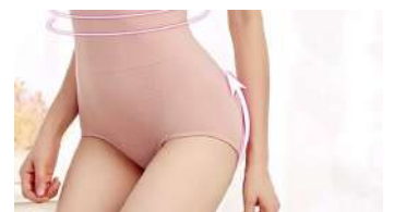
הסוד אותו הסלסב לובשות וכן מתגאות בבטן שטוחה וישבן מורם Health MAGIC Pants™ | ממומן