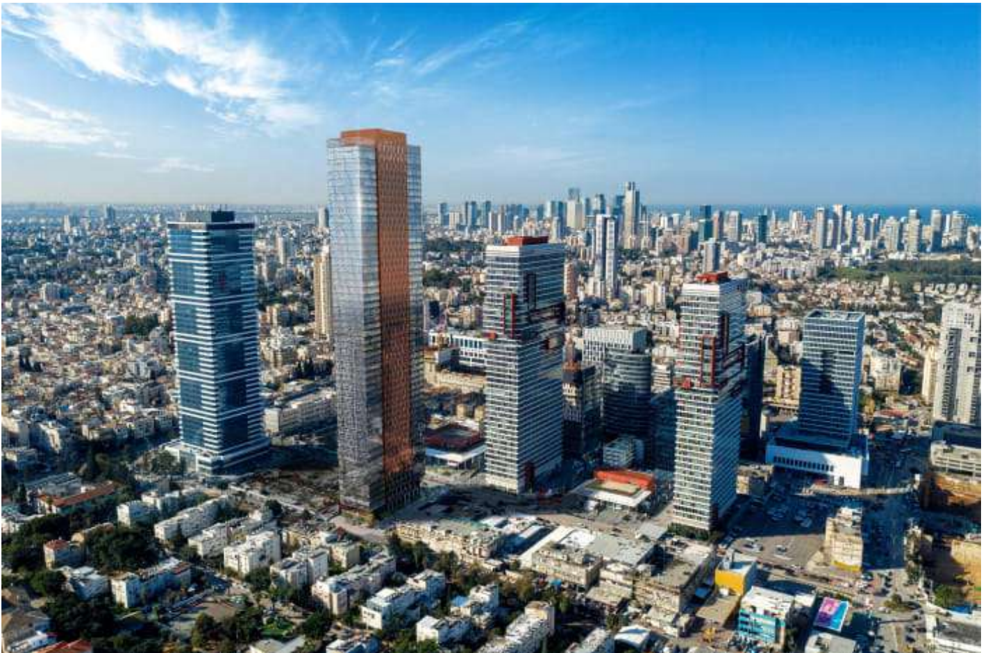
"סו'בסיס לוחה השכירות שחברות מעוניינות לסגור בפרויקט". מגדל שבעת הכוכבים (צילום: הדמיה)

החשיבה על כך מתחילה עוד בשלב תכנון בניין המשרדים החל מסוג החומרים בהם בוחרים להשתמש, למשל חומרים שיפלטו פחות פחמן לאוויר, חשיבה על ניקוז מי גשמים ומניעת הצפות בחניון, חיסכון בחשמל, שימוש במי מזגנים להשקיה ועוד. כאמור, במערכת המועצה האמריקאית לבניה ירוקה רשומים כיום 144 פרויקטים בישראל הפועלים להשיג את התקן המבוקש, מתוכם 61 כבר קיבלו הסמכה והיתר נמצאים בתהליכי הסמכה.