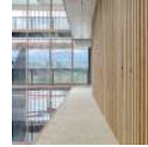
Wood-based materials in EGGER Headquarters

ZGF is working on the new terminal core vision to define the airport of the future while minimizing the amount of disruption to ongoing operations during the transition. Building upon concepts established in the Terminal Access Master Plan, this project is designed to address the consistent and coordinated look, flow, and function of the terminal core resulting in a cohesive terminal space. Scheduled for completion in 2025, the terminal will be the largest of five capital improvement projects by the Port of Portland.