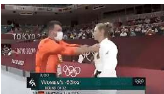
אחרי הסרטון המטריד: ההסבר לתקרית "המאמן המתעלל" וואלה