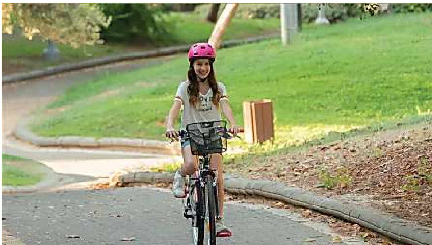
משהו חדש קורה בשיכון צמרת הוותיקה גלובס | ממומן